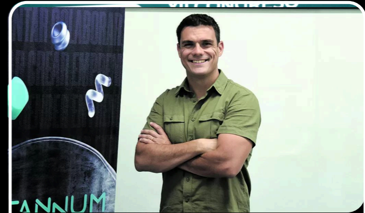
Entrena emprendedores en estaño tras un drama que lo sacó de la arquitectura" – La Gaceta (2022)