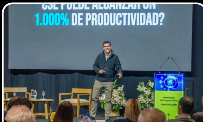
"Dominar o ser dominado": cómo ser pilotos de Fórmula 1 con la IA - El Tribuno 2025