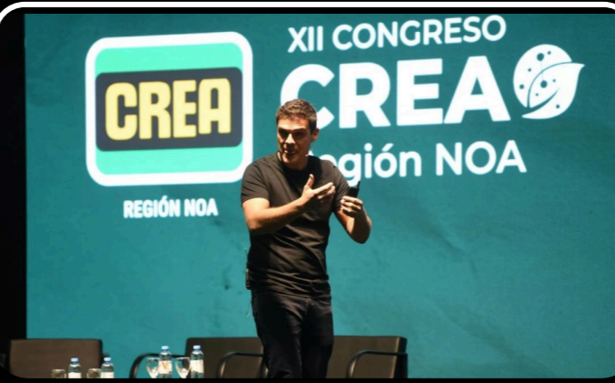
Merlini en el Congreso CREA: hay que hacerle transpirar el cerebro a la IA" – La Gaceta (2023)