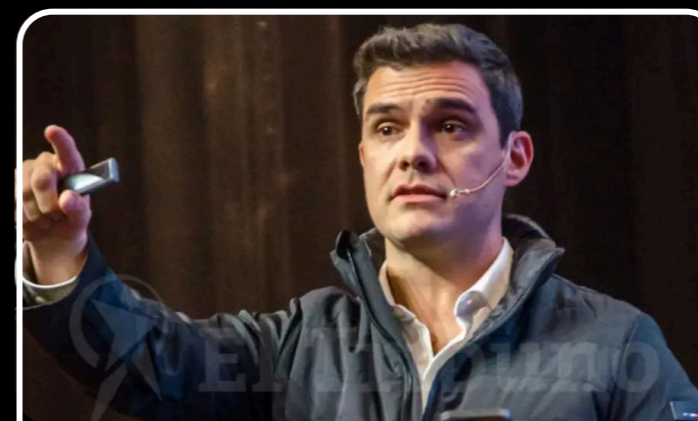
Del prompt al poder: claves para dominar la inteligencia artificial, según Merlini - El Tribuno 2025